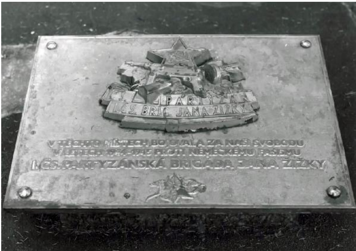
Znak brigády na památníci odboje s textem 1. čs. partyzánská brigáda Jana Žižky. Foto 1975, originál SOKA Vsetín.