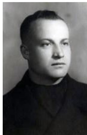
Agapitus Bláha Originál SOKA Vsetín