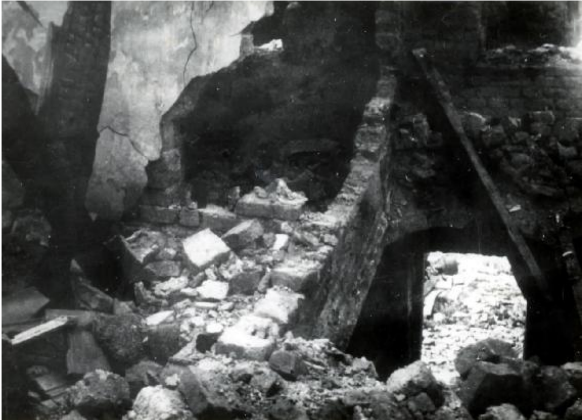
Dům rodiny Juříčkovy po vypálení. Foto 1945.