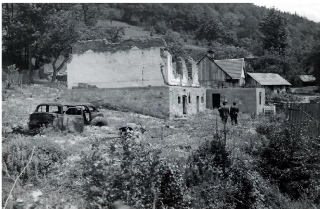
Dům rodiny Juříčkovy po vypálení. Foto 1945, originál SOKA Vsetín.