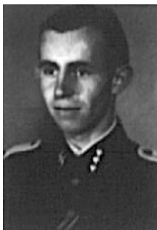
Hans Schrader Originál ABS Praha