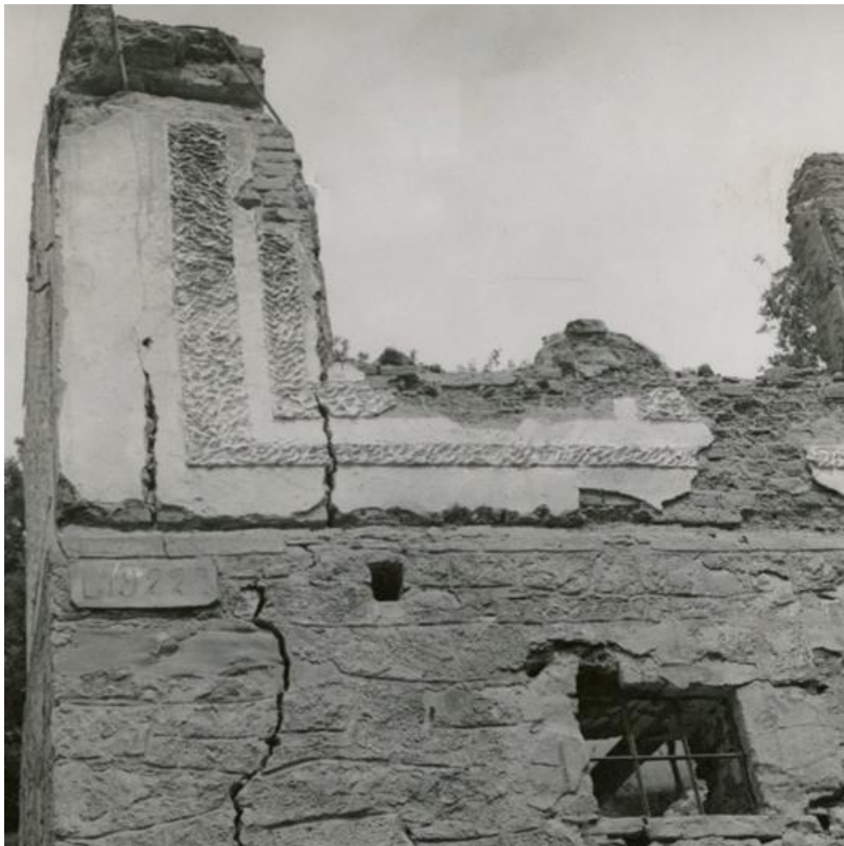
Dům rodiny Juříčkovy, na snímku je patrná tabulka s datem dokončení první přestavby domu.