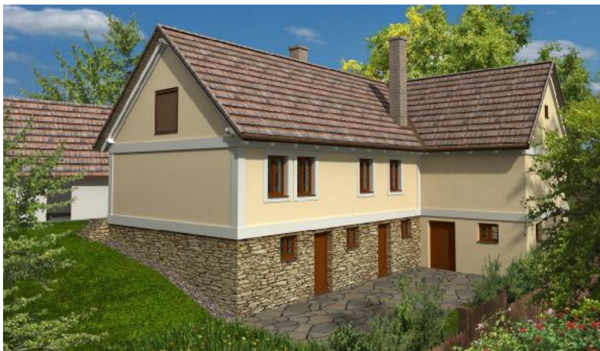
Možná podoba Juříčkovy usedlosti, 3D model, originál OZS sociální podnik s.r.o. Bystřice pod Hostýnem.