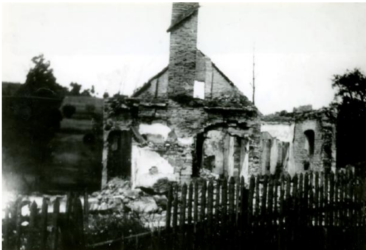
Dům rodiny Juříčkovy po vypálení. Foto 1945.